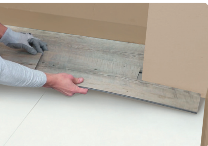
Revolution on erittäin kestävä lukkopontti, joten lankut ja laatat voidaan asentaa turvallisesti Gerflorin oman aluskatteen päälle, jolloin askeläänen parannusarvoksi saadaan jopa 19 dB.