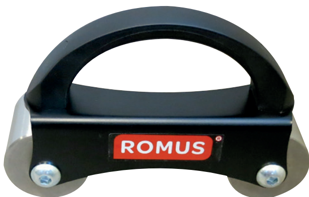
Vinyylilankkujen pontit asennetaan toisiinsa kuminuijalla vasaroiden tai uudella Clic -asennusrullalla, jonka avulla asennus sujuu entistä helpommin ja nopeammin.