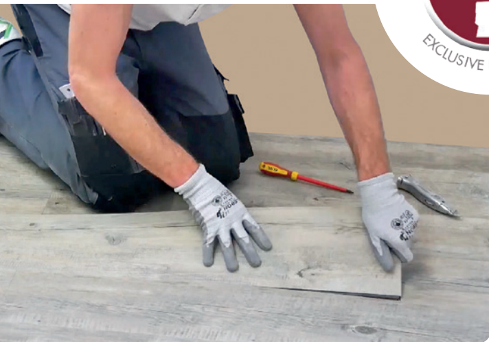
Yksittäisen lankun voi vaihtaa helposti keskeltä lattiaa.